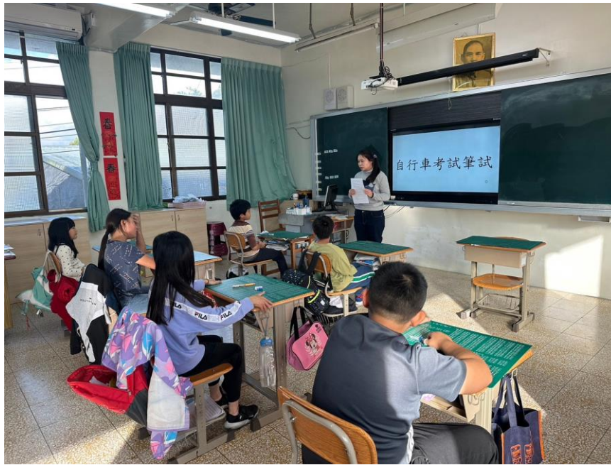
說明：與四年級說明自行車筆試