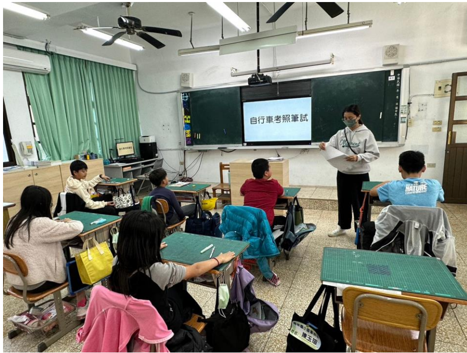
說明：與五年級說明自行車筆試