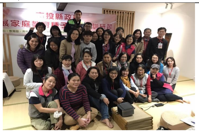
承辦人參加家庭教育教育中心的研習證明